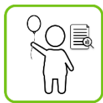
PERSONUPPGIFTER AV BARN